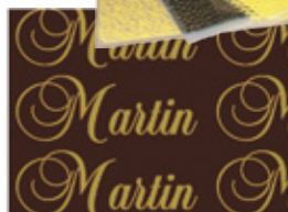
all-over CONTINUE 2