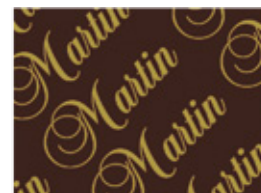
all-over TRAVERS 2